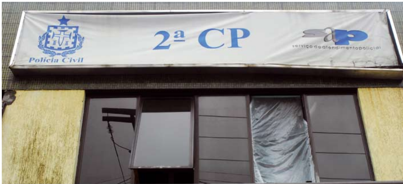
Delegacias da capital enfrentam problemas de infraestrutura e a situação é ainda pior no interior

Na Bahia, existem 872 delegados na ativa que trabalham nas unidades espalhadas por 417 municípios. A maioria das delegacias não dispõe de estrutura e ferramentas em bom estado para a investigação e os procedimentos policiais, principalmente no interior. Os delegados trabalham sob risco de rebeliões, em ambientes insalubres, sem recursos humanos em número suficiente nas unidades (agentes de polícia, escrivães, auxiliares de limpeza etc), além das condições precárias da tecnologia disponibilizada para o cumprimento da função.