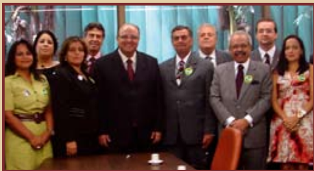
Diretoria dialoga com deputados e líderes do governo

A diretoria da ADPEB e os delegados da Bahia estão atentos aos desdobramentos da PEC 549, em tramitação na Capital Federal, e aguardam que sejam definidas na Câmara dos Deputados, pela Comissão de Análise e Seleção, as propostas de emendas que entrarão em votação ainda este ano.