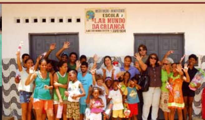
Diretoria da ADPEB distribui presentes de Natal para as crianças