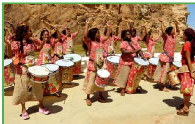
A Banda Didá abriu o evento com muita energia