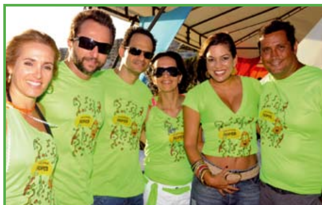
Os delegados, amigos e familiares se divertiram na festa