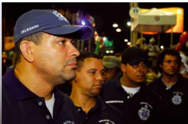
Durante o Carnaval, delegados baianos atuam dentro e fora dos postos de polícia