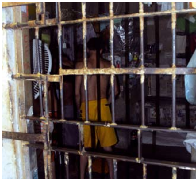
Carceragens sem condições de higiene e segurança